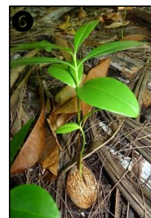
① Allure générale ② Fleurs ③ Fruits ④ Graines ⑤ Plantule ⑥ Plant