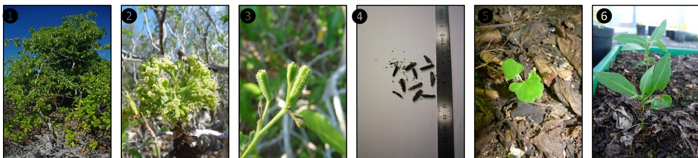
① Allure générale ② Fleurs ③ Fruits ④ Graines ⑤ Plantule ⑥ Plants

Description du fruit et de la graine : faux fruit ressemblant à un akène, en forme de massue de 8-15 mm de long, à 5 rangs de poils glanduleux, vert-clair devenant noir sur le sec, contient une unique graine qui occupe presque toute la longueur du fruit