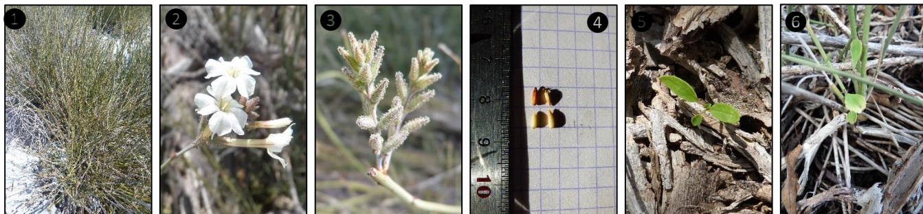
① Allure générale ② Fleurs ③ Fruits ④ Graines ⑤ Plantule Plant

Description du fruit et de la graine : fruit de type capsule, en forme de tube de 7-9 mm de long, à poils glanduleux, s'ouvrant tardivement par des fentes de déhiscence transversales, contient une unique graine brune à noire, allongée, et légèrement aplatie latéralement.