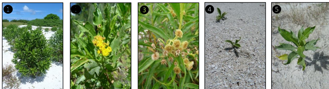
① Allure générale ② Fleurs ③ Fruits ④ Plantules ⑤ Plant

Description du fruit et de la graine : fruit de type akène, de forme allongée, de quelques mm de long, indéhiscent, surmonté par une soie brillante, jaune devenant brun à maturité, contient une unique graine