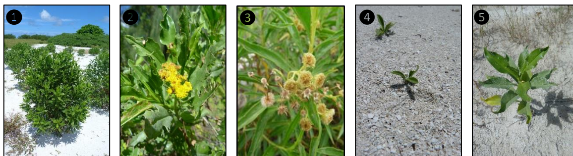
① Allure générale ② Fleurs ③ Fruits ④ Plantules ⑤ Plant

Description du fruit et de la graine : fruit de type akène, de forme allongée, de quelques mm de long, indéhiscent, surmonté par une soie brillante, jaune devenant brun à maturité, contient une unique graine