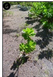
① Allure générale ② Fleurs ③ Fruits ④ Fruits secs ⑤ Plantule ⑥ Plant © CBNM - J. Hivert / C. Moellon