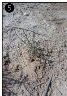
① Allure générale ② Fleurs ③ Fruits ④ Plantules ⑤ Plant