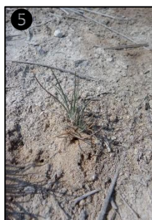
① Allure générale ② Fleurs ③ Fruits ④ ⑤ Plantules