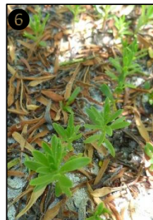
① Allure générale ② Fleur ③ Fruit ④ Graines ⑤ Plantule ⑥ Plants