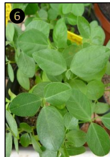
① Allure générale ② Fleurs ③ Fruits ④ Graine ⑤ ⑥ Plantules