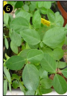
① Allure générale ② Fleurs ③ Fruits ④ Graine ⑤ Plantule ⑥ Plant