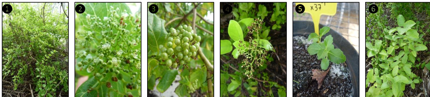
① Allure générale ② Fleurs ③ Fruits ④ Fruits ⑤ Plantules ⑥ Plants

Description du fruit et de la graine : fruit de type drupe, légèrement charnu, de forme sphérique de 3-6 mm de diamètre, devenant noir bleuâtre à maturité, contient une unique graine en forme de rein, côtelée à la base et bosselée au sommet, d'environ 1,5 x 1 mm