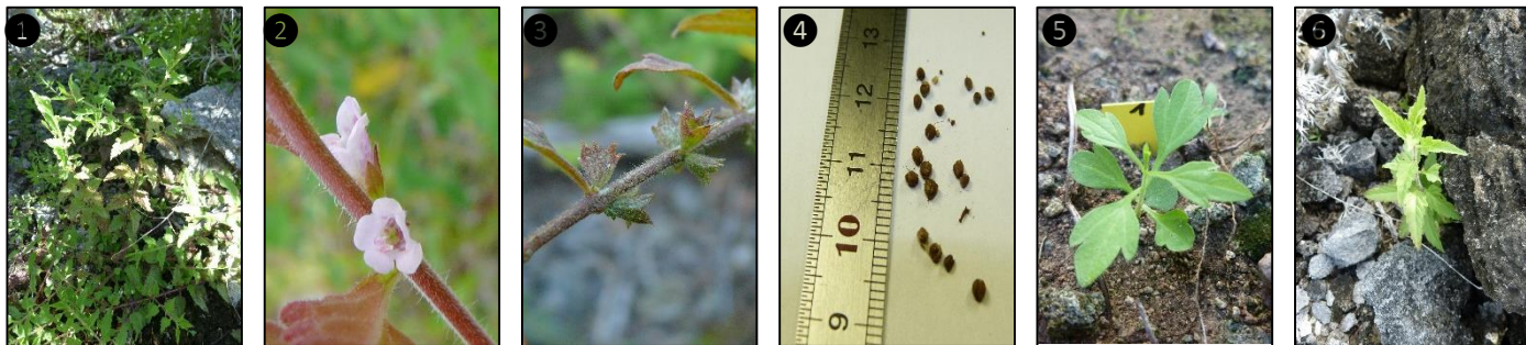
① Allure générale ② Fleurs ③ Fruits ④ Graines ⑤ Plantule ⑥ Plant

Description du fruit et de la graine : fruit indéhiscent, de forme ovoïde, de 2-3 mm de long, surmonté par la base du style persistant, vert-clair à foncé à maturité, contient 2 graines de forme allongée et à surface marquée par des aspérités alignées en rangs longitudinaux