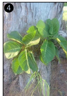
① Allure générale ② Fruits ③ Plantule ④ Plant