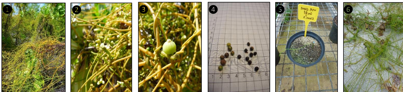
① Allure générale ② Fleurs ③ Fruits ④ Graine ⑤ Plantule ⑥ Plant

Description du fruit et de la graine : fruit charnu de type drupe, à peu près sphérique, atteignant 8 mm de diamètre, blanc à maturité, à paroi externe mince renfermant une graine unique à noyau très dur, d'environ 5 à 7 mm de diamètre