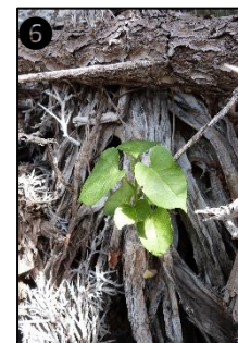
① Allure générale ② Fleurs ③ Fruits ④ Graine ⑤ Plantule ⑥ Plant