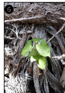
① Allure générale ② Fleurs ③ Fruits ④ Graine ⑤ Plantule ⑥ Plant