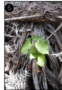
① Allure générale ② Fleurs ③ Fruits ④ Graine ⑤ Plantule ⑥ Plant