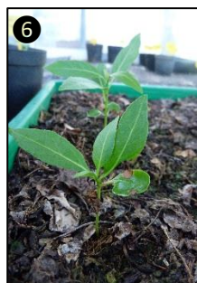
① Allure générale ② Fleurs ③ Fruits ④ Graines ⑤ Plantule ⑥ Plants