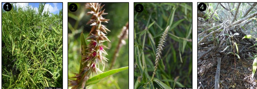
① Allure générale ② Fleurs ③ Fruits ④ Plant

Description du fruit et de la graine : fruit sec indéhiscent, de type capsule, dure, brunâtre, entourée par les pièces florales et bractées persistantes, de forme ± cylindrique, de 1,8 mm x 0,8 mm, contient une seule graine de forme cylindrique, lisse