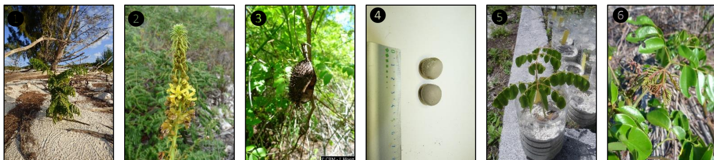
① Allure générale ② Fleurs ③ Fruit ④ Graines ⑤ Plantule ⑥ Plant

Description du fruit et de la graine : fruit sec de type gousse, de forme ± elliptique, de 4,5-9 x 3,5-5 cm, recouvert de longs aiguillons, s'ouvrant à maturité par des fentes de déhiscence, contient 1 à 2 graines, ± ovales à sphériques, de 1,5-2 cm de diamètre, grises, lisses et très dures