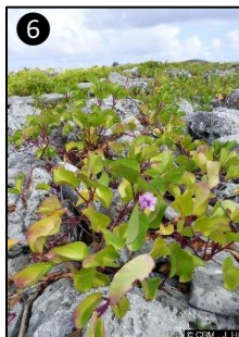
① Allure générale ② Fleur ③ Fruit ④ Graines ⑤ Plantule ⑥ Plants