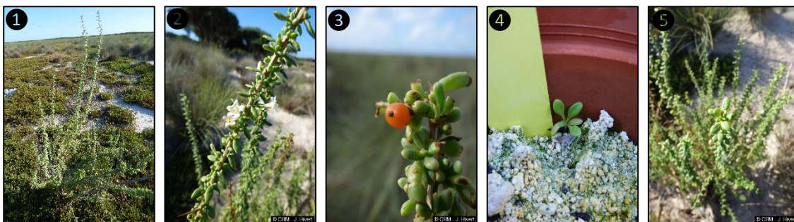
① Allure générale ② Fleurs ③ Fruit ④ Plantule ⑤ Plant

Description du fruit et de la graine : fruit de type baie charnue, de forme ± ronde ou ovale, rouge à orangé à maturité, en partie enveloppée par le calice persistant, contient un nombre variable de graines de petite taille en forme de rein