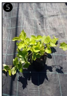
① Allure générale ② Fleurs ③ Fruits ④ Plantules ⑤ Plant