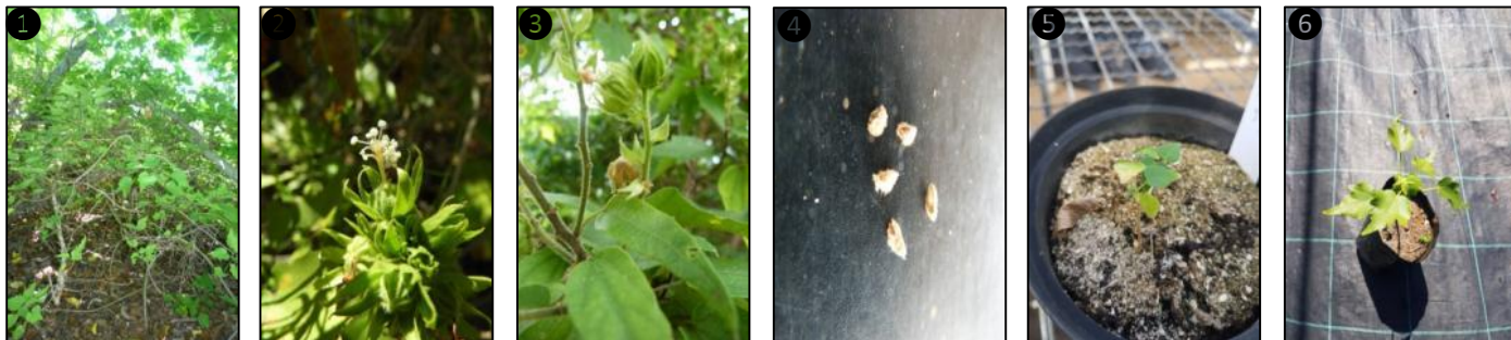
① Allure générale ② Fleur ③ Fruits ④ Graines ⑤ Plantule ⑥ Plant

Description du fruit et de la graine : fruit de type capsule sphérique, d'environ 1 cm de diamètre, recouverte de poils, brun clair et s'ouvrant à maturité, à 5 loges contenant chacune une graine de 0,4-0,5 mm de long densément couverte de poils roux