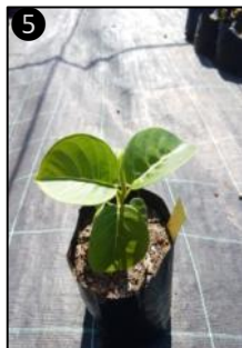
① Allure générale ② Fruits ③ Fruits et graines ④ Plantules ⑤ Plant