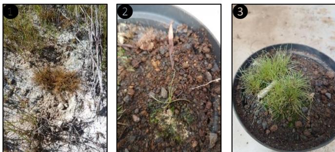
① Allure générale ② Plantule ③ Plants

Description du fruit et de la graine : fruit de type akène trigone à légèrement convexe, rétréci vers la base et arrondi au sommet, de 1-1,2 mm de long, brun pâle à sombre, nettement ridé transversalement