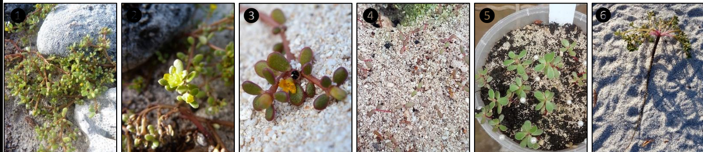
① Allure générale ② Fleurs ③ Fleur et fruit ④ Plantules ⑤ Plants ⑥ Pivot racinaire

Description du fruit et de la graine : fruit de type capsule, en forme de coupelle surmontée d'un chapeau, de quelques mm de diamètre, s'ouvrant à maturité par une fente de déhiscence transversale, contient de très nombreuses graines noires, dures, réniformes et de ± 0,6 mm de long