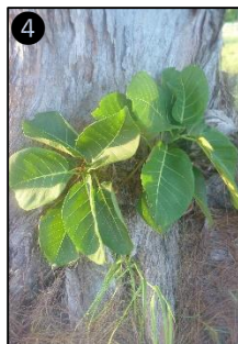
① Allure générale ② Fruits ③ Plantule ④ Plant