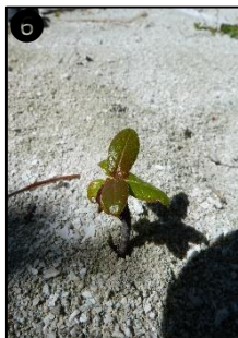
① Allure générale ② Fleur ③ Fruits ④ Fruits ⑤ Plantule ⑥ Plant