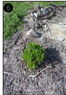
① Allure générale ② Fleurs ③ Fruits ④ Graines ⑤ Plantule ⑥ Plant