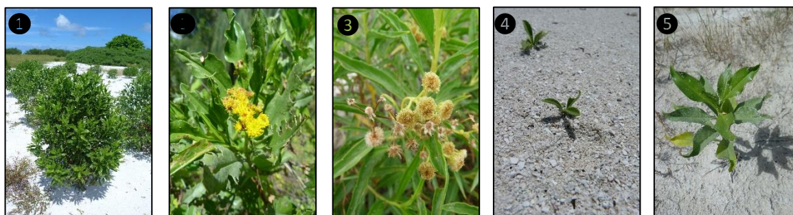
① Allure générale ② Fleurs ③ Fruits ④ Plantules ⑤ Plant

Description du fruit et de la graine : fruit de type akène, de forme allongée, de quelques mm de long, indéhiscent, surmonté par une soie brillante, jaune devenant brun à maturité, contient une unique graine