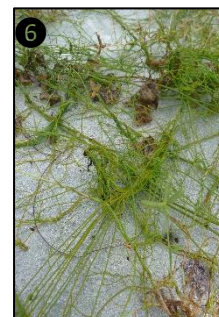
① Allure générale ② Fleurs ③ Fruits ④ Graines ⑤ Plantule ⑥ Plant