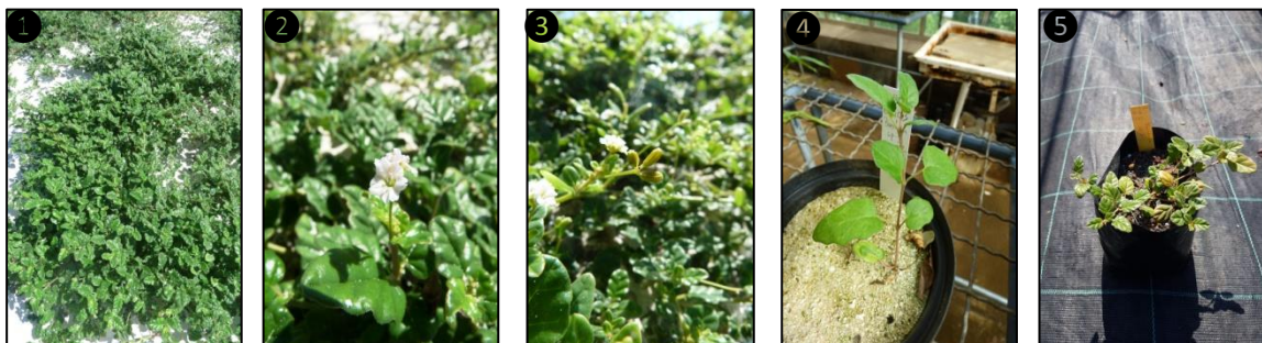
① Allure générale ② Fleurs ③ Fruits ④ Plantule ⑤ Plant

Description du fruit et de la graine : fruit obovale, à 5 côtes, portant de petits poils glanduleux, brun à maturité, contenant une unique graine de quelques mm de long