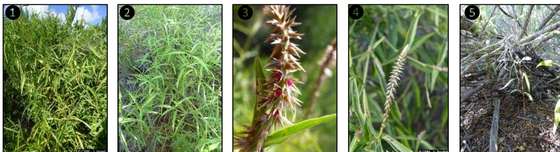
① ② Allure générale ③ Fleurs ④ Fruits ⑤ Plantule

Description du fruit et de la graine : fruit sec indéhiscent, de type capsule, dure, brunâtre, entourée par les pièces florales et bractées persistantes, de forme ± cylindrique, de 1,8 mm x 0,8 mm, contient une seule graine de forme cylindrique et lisse