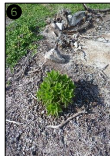
① Allure générale ② Fleurs ③ Fruits ④ Graines ⑤ Plantule ⑥ Plant